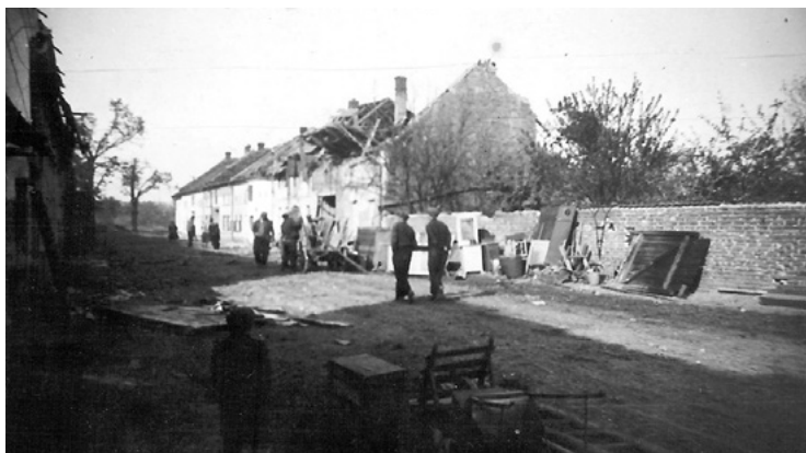
Poškozené domy na Floriánské ulici. V popředí dům Koutných (č. p. 117) zasažený leteckou bombou.