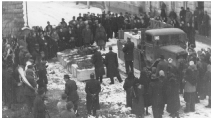
Exhumace padlých sovětských vojáků, 16. 2. 1946.