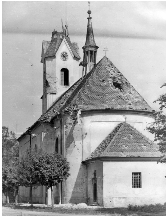
Bojovými operacemi poškozený kostel v Čehovicích.