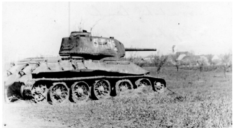
Sovětský tank v Lejskově sadě, jenž byl zničen 4. 5. 1945. Vzadu silueta poškozeného kostela v Čehovicích.