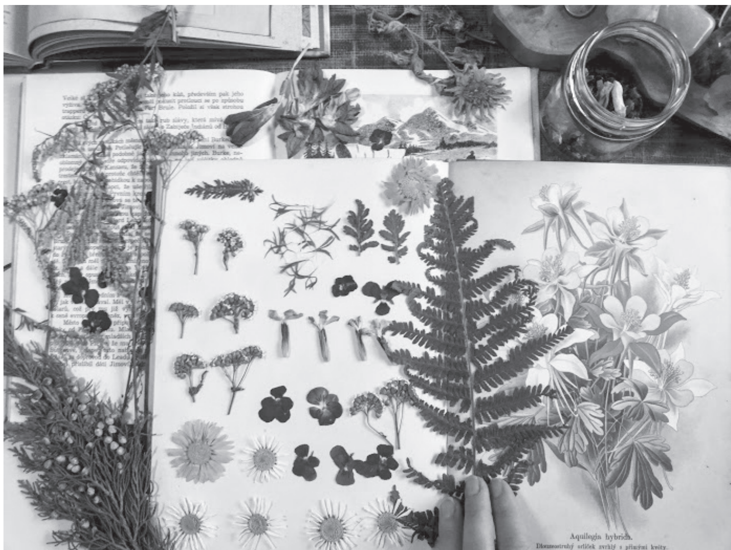
Aquilegia hybrid. Dvoznostřížý stříšek světlý s pláznivými květy.