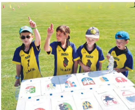
Dětské olympijské hry ve Výšovicích