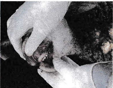
Změny v dutině ústní

V případě zjištění výše uvedených příznaků ihned kontaktujte soukromého veterinárního lékaře nebo příslušnou krajskou veterinární správu.